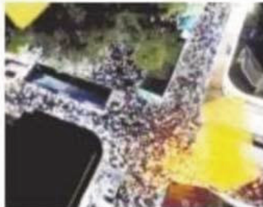
Fotografía aérea de las Patronales de Ocoa 2023.

La acostumbrado espectáculo musical que genera este evento marca país, organizado por la Alcaldía de San José de Ocoa desde el